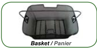
Basket / Panier