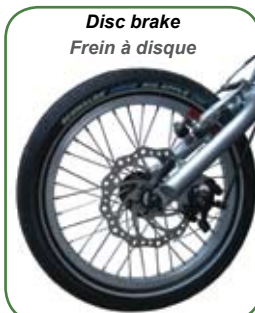
Disc brake Frein à disque