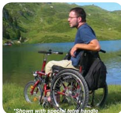
*Shown with special tetra handle

Having the same features and uses as the Lomo 360 it attaches in the same way and allows the front casters of the chair to be raised of the ground automatically with minimal effort. When attached to the wheelchair it increases the persons ability to cross obstacles and roll without effort. Rocks, cobble-stones, pathways, uneven terrain, snow, etc. It can be attached to fixed frame and folding frame wheelchairs.