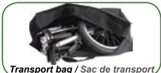
Transport bag / Sac de transport