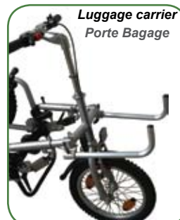
Luggage carrier Porte Bagage