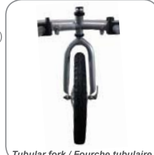
Tubular fork / Fourche tubulaire