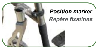
Position marker Repère fixations