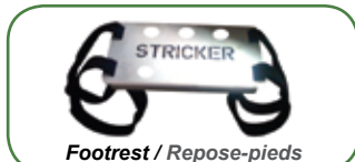
Footrest / Repose-pieds