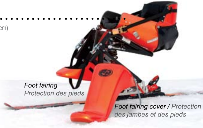
Foot fairing Protection des pieds