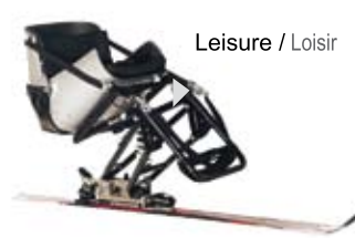
Leisure / Loisir

The Monoski is available in two versions : one for leisure and another for racing. The racing version is frequently used by International ski teams which confide in its high performance and its sophistication. / Le Monoski Praschberger est disponible en deux modèles : Loisir & Compétition. Le monoski Praschberger est le leader des compétitions internationales en matière de ski assis. Jusqu'à ce jour, il est utilisé par la majorité des équipes nationales paralympiques.