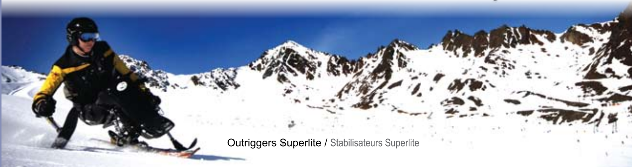
Outriggers Superlite / Stabilisateurs Superlite