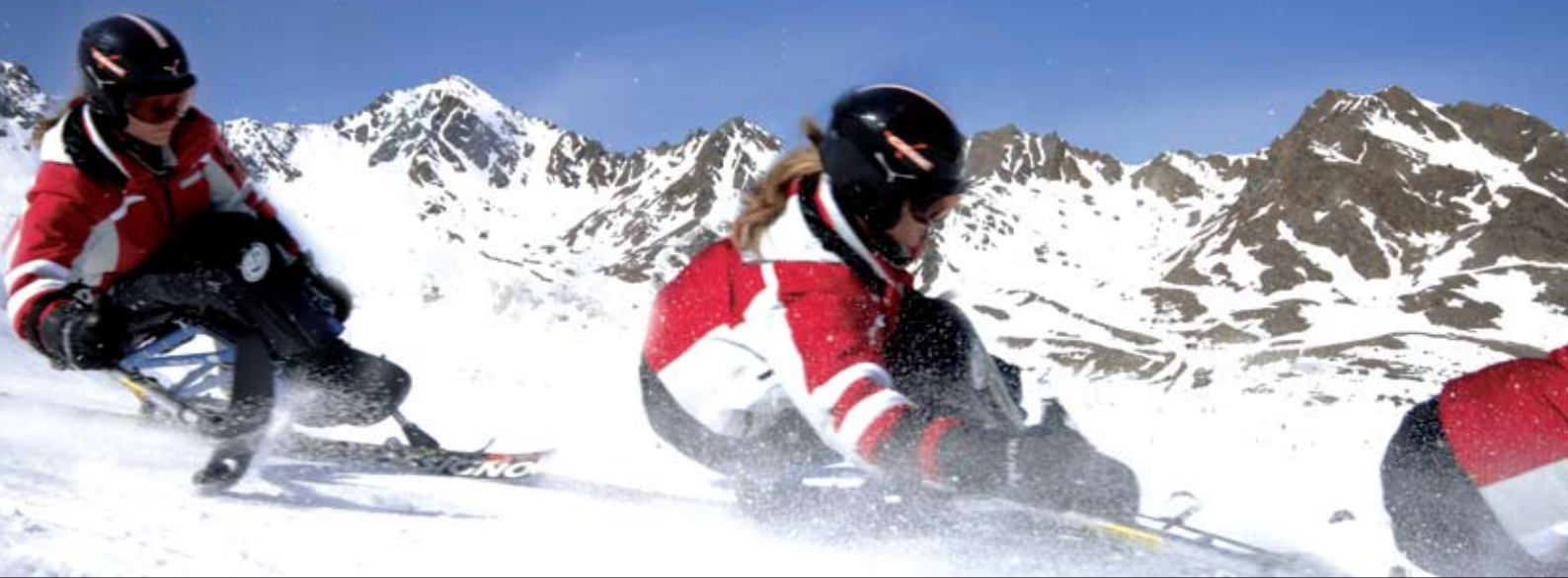
Foot fairing cover / Protection des jambes et des pieds