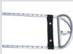
Telescopic nose Marche-pieds télescopique