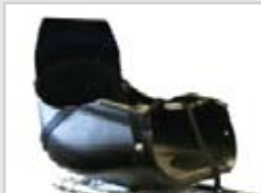
Back support Réhausseur de dossier