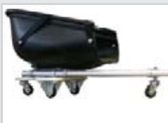
Kit wheels Kit à roulettes