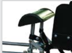
Knee support Repose-genoux