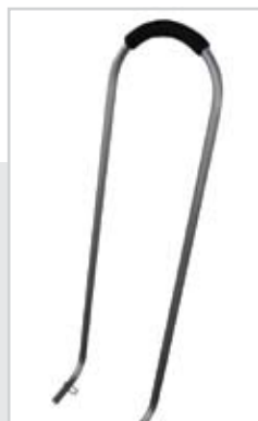
Push bar Barre de poussée