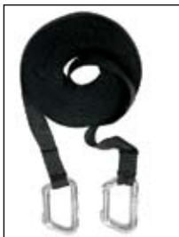
Safety cord & Carabiners Sangles & mousquetons

Handle bar extension / Barre d'extension : Additional support for assistant / Barre d'extension amovible afin de soulager le dos de l'accompagnateur.