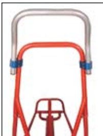
Handle bar extension Barre d'extension